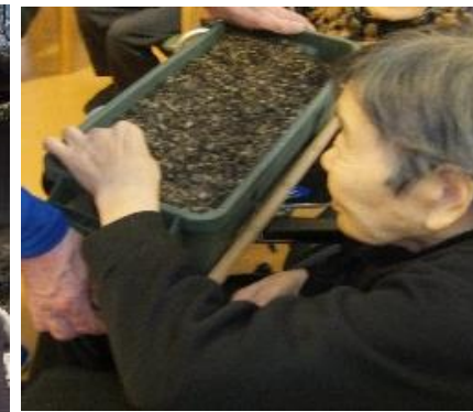
4月、向日葵の種を植えました。夏が楽しみ。