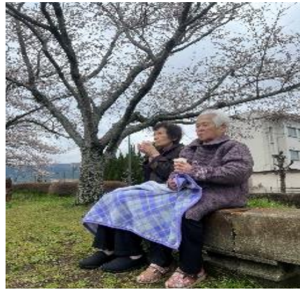
4月、桜の花を見に外出。天気も良く、花もきれいでした。