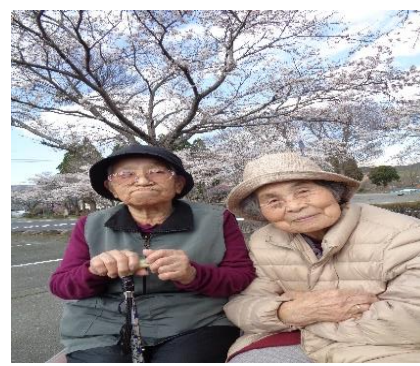
4月4・5日、内牧体育館へ桜の花を見に行きました。満開の花を見て皆さん笑顔になりました。