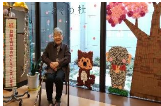
誕生日の記念にパチリ！！